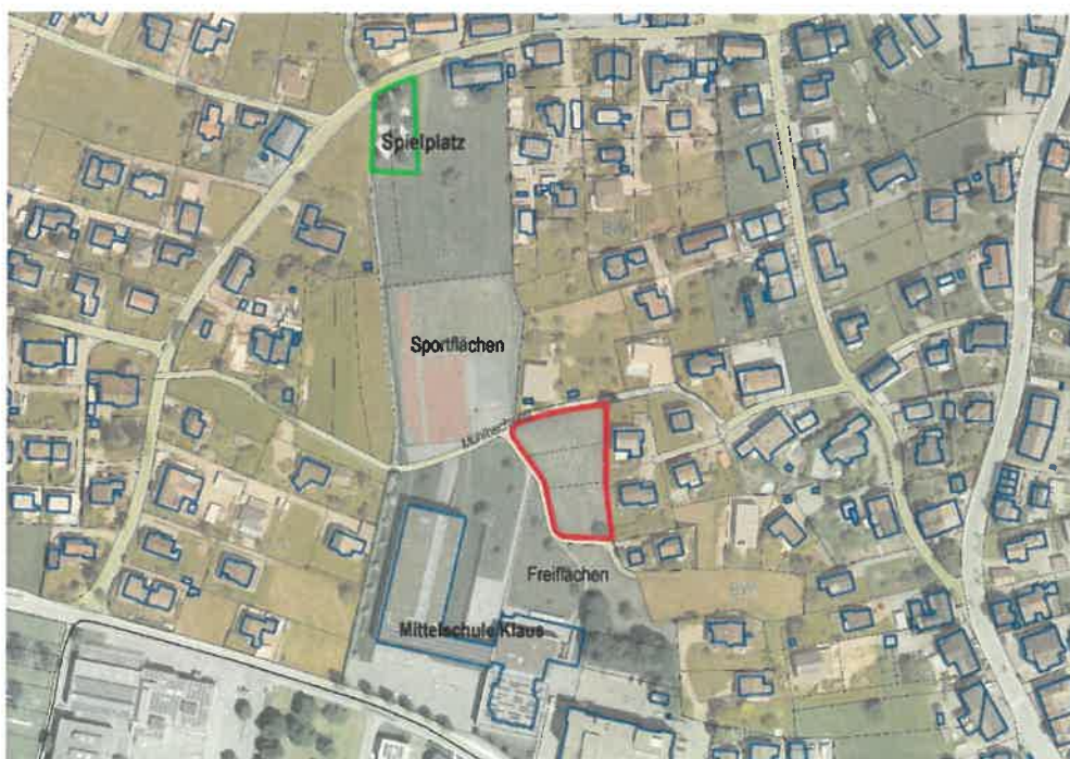
Abb.1 Die Umgebung mit dem Spielplatz, die Mittelschule mit den Sportflächen und die beantragte Umwidmungsfläche.

Die Gemeinde Klaus hat bereits in der Nähe (Schmalzgasse) einen Spielplatz auf Gst.Nr. 549 und 551 errichtet. Unter Berücksichtigung der bestehenden Spielplatzsituation in diesem Quartier wird die gewidmete Vorbehaltsfläche Kinderspielplatz (unterlegte Widmung Baufläche Wohngebiet) auf den betroffenen Parzellen, nach gründlicher Abwägung in der Gemeinde Klaus, zukünftig nicht mehr benötigt. Unter Berücksichtigung dieser Tatsache beabsichtigt die Gemeinde Klaus nicht die Grundstücke bzw. Teilflächen für einen zukünftigen Spielplatz zu erwerben.