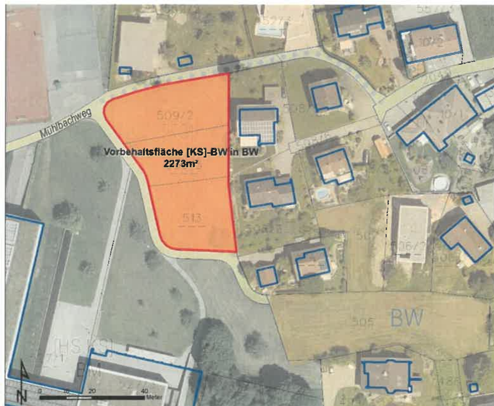
Abb: 2: Orthofoto Bereich Mittelschule Klaus und Mühlbachweg mit den dargestellten Widmungsänderungen, KG Klaus

Die Flächenwidmung NEU (nach Umwidmung) am Mühlbachweg, gemäß Gemeindevertretungsbeschluss vom 7.7.2021 siehe nachfolgender PLAN.